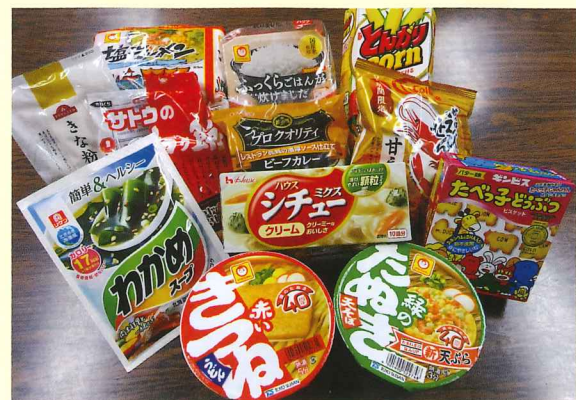
※給付食料イメージ