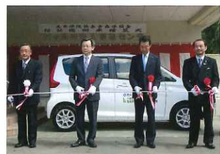
老人福祉センターにて福祉巡回車贈呈式