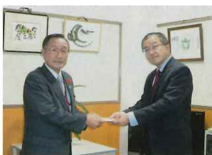
瀬尾所長（右）より橋本会長へ