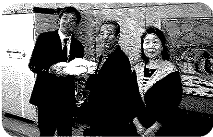
尾駸町内会いきいきサロンより尾駸小学校 へぞうさんの寄付

ふれあいいいききサロンは地域住民が誰で も気軽に参加できる集いの場です。現在、泊 地区と尾駸地区でそれぞれに合った運営の仕 方で開催されています。皆さんの地区でも開 催してみませんか。お気軽にお問い合わせく ださい。