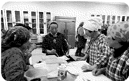
泊いきいきサロン 栄養教室