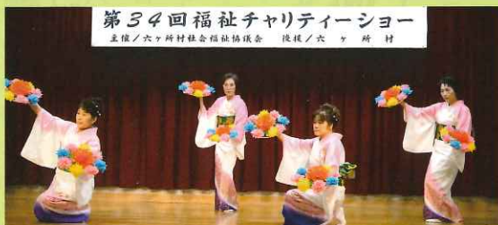
第34回福祉チャリティーショー 主催/六ヶ所村社会福祉協議会 後援/六ヶ所村

十一月十九日(日)平沼の老人福祉センターにおいて、第三十四回福祉チャリティーショーが開催されました。今年には村内の各団体から三十四の歌や踊りが発表され、ご来場の皆様と出演者が一緒に歌い感動し、心あたたまる時間を過ごすことができました。また、今年も会場に福祉募金