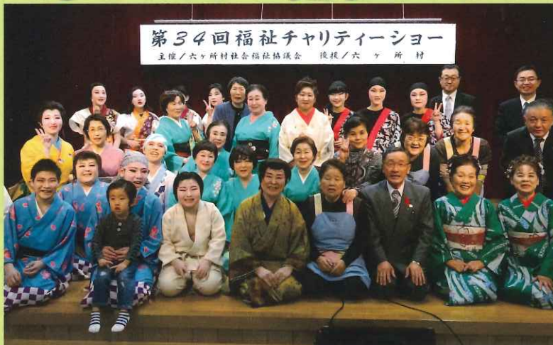
第34回福祉チャリティーショー 主催/六ヶ所村社会福祉協議会 後援/六ヶ所村

十一月十九日(日)平沼の老人福祉センターにおいて、第三十四回福祉チャリティーショーが開催されました。今年には村内の各団体から三十四の歌や踊りが発表され、ご来場の皆様と出演者が一緒に歌い感動し、心あたたまる時間を過ごすことができました。また、今年も会場に福祉募金