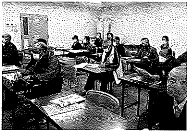
(六ヶ所村老人クラブ連合会 役員研修会)

令和6年現在12の老人クラブが活動中です。 貴宝、末広、諏訪、老部川、浜、尾駈、 室ノ久保、戸鎖、平沼、庄内、千歳平、千歳 ご興味のある方はお気軽にご連絡ください。 六ヶ所村老人クラブ連合会事務局 (電話) 75-33000