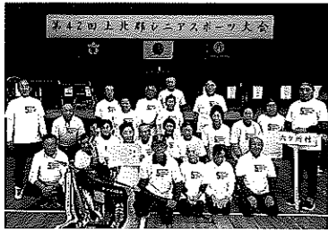
(第42回上北郡シニアスポーツ大会)